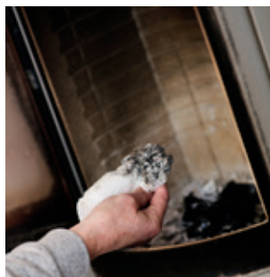
Rengör insidan på glaset med en fuktig trasa doppad i den helt fina askan i kaminen.