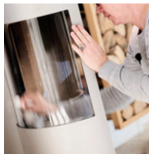
Torka efter och polera med en mjuk trasa.