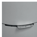
POS 1 - UPPSTART

Du kan inte reglera värmen i rummet med spjället, utan endast med mängden ved.