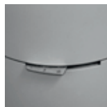
POS 3 - STÄNGT