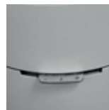
POS 2 - I DRIFT