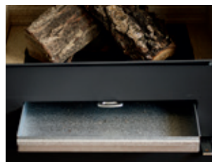
Rystgallret rörs fram och tillbaka för att leda ner askan i asklådan.

Brännkammaren töms för aska efter behov. Du kan ta ut askan försiktigt med en liten handskyffel. Askan ska vara helt avkyld innan den kasseras, då det kan gömma sig glöd i askan i upp till två dagar. Om din kamin har ett rystgaller, brukar det leda askan ner i asklådan. Rystgallret rörs fram och tillbaka med handtaget, se bilden nedanför. Kom ihåg att använda en handske när kaminen är varm. Skjut in handtaget innan luckan öppnas. Töm aldrig brännkammaren helt för aska, då elden brinner bäst ovanpå ett litet asklager.